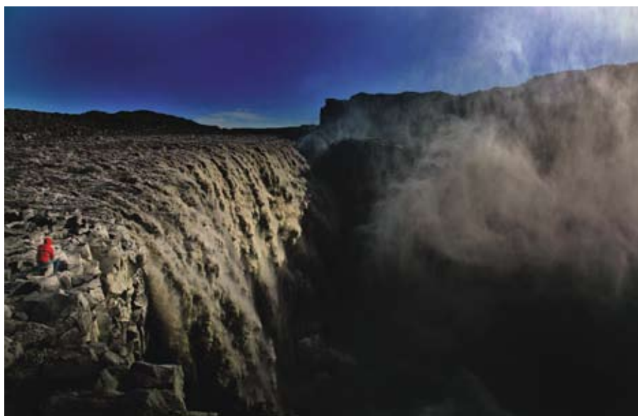
Dettifoss - Európa legnagyobb vízhozamú, döbbenetesen dübörgő vízesése (piros kabátban a cikk egyik szerzője)