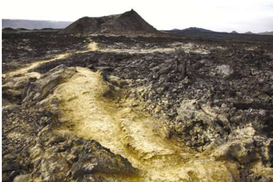
ISO 100, 1/100, f 71, 24mm