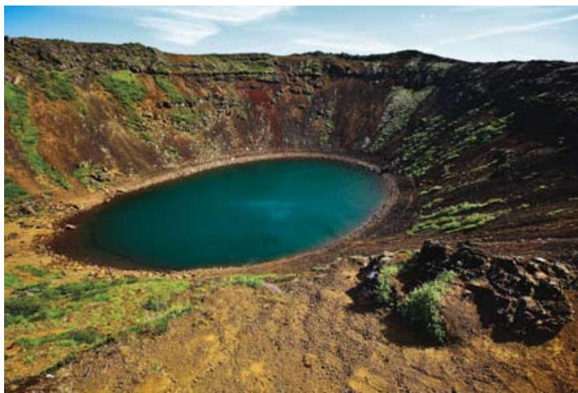
Kerid - Tengerszemnek hihetnénk, pedig csak egy kialudt vulkánkráter tava

nem kell félni attól, hogy meglopnak vagy megkárosítanak. Vajon a zord időjárás, a ködös, földközébe ereszkedő felhőzet formálta ilyenné az embereket? Az egymásra utaltság? Hogy kevesen vannak, és ki kell tartani? Büszke féltéssel őrzik természeti kincseiket: az ökoturizmus nemcsak a külföldiek, hanem a rekreálódásra vágyó izlandi lakosság körében is népszerű, kevesen mennek külföldre nyaralni, inkább körbeciclik a sziget körüli 1500km-es utat, vagy lakóautókban vándorolnak a hepehupás makadámon – vonat ugyanis egyáltalán nincs. Védik ősi nyelvüket (1955-ben irodalmi Nobel-díjat kapott Halldór Laxness, izlandi író), dagad a keblük, ha kulturális exportcikkeikre gondolnak (a popzenész Björk-re, vagy a Chelsea-ben és a Barcelonában focizó Gudjohnsenre), az EU-ba nem lépnek be, nehogy kizsákmányolják a halászföldjeiket.