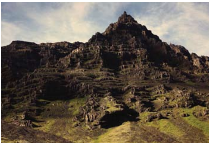
Reynivellir hegyláncai az Andok csúcsaira emlékeztetnek

lundakolóniák otthonos közegben! A képek ugyan árulkodnak a lenyűgöző természetről, a gleccsertavaktól kezdve a kénes kipárolgású iszapfortyogókon át a jéghidegen üdítő, bazaltoszlopos vízesésekről – tegyük hozzá, mindez nem photoshop-manipuláció –, de nem árulkodnak az ott élő emberekről.