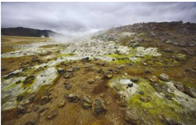
Námafjall gőzölgő, pokolsaras hegye és Hverir kénes iszapfortyogói, szolfatárái