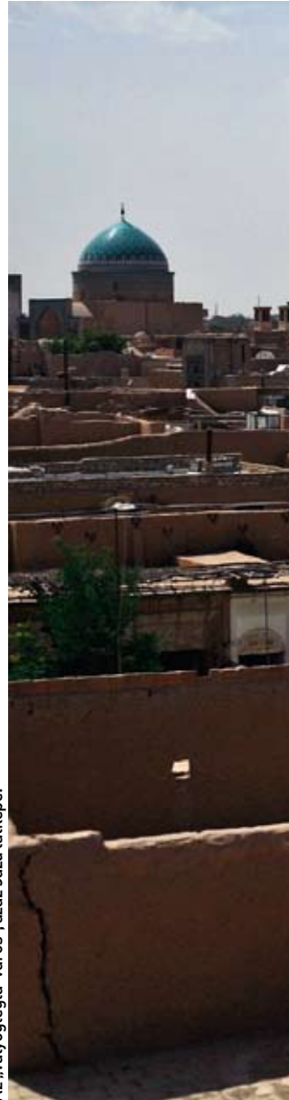
Az „vályogtégla-város”, azaz Jazd látképe.

Nem belemenve további kényes témába, annyit mindenképpen rögzítenék: Iránba feltétlenül érdemes elmenni! Csofátatos tájak, turista elvétve, elképesztő vendégszeretet és fogadókészség mindenrel kapcsolatban. Ilyet utoljára Mongóliában tapasztaltam. Pénztárca-kímélő és kalandos, nem utolsósorban garantáltan biztonságos utazás. A bazároknak, pedig minden kapható: a pinkre és zöldre festett bundájú kiscsibétől kezdve sosem volt, világmárkás cipőig (a márkajeles talpat, a hamisított felsőrészt és a logókat külön üzletekben készítik, s egy negyedikben varrják össze: így lehet Adidas talpú, Lacoste-fazonú,