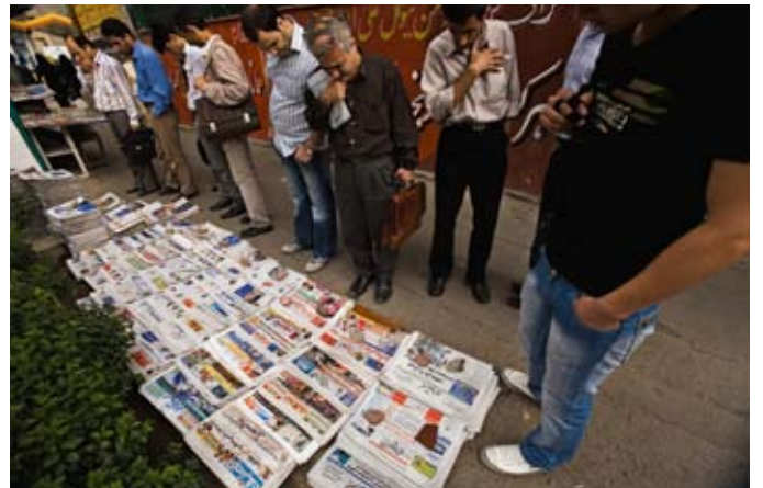
Munkába igyekvő teheráni férfiak böngészik a reggeli iráni újságok címlapját.

veztek el/át), majd vissza Teheránba. Lehetne hosszan mesélni arról, hogyan énekeltem a teheráni metróban magyar népdalokat egy etnozenét gyűjtő fiatalembernek, hogyan társalogtam éjszaka nyúlóan zandjabillal (őrölt fahéj és gyömbér babonázó keverékével) ízesített teát kortyolva az iszfaháni hidak mentén, hogyan pirultam el, amikor egy-egy gyönyörű szempár a fekete csador alól rám pillantott, hogyan tartóztattak le két-