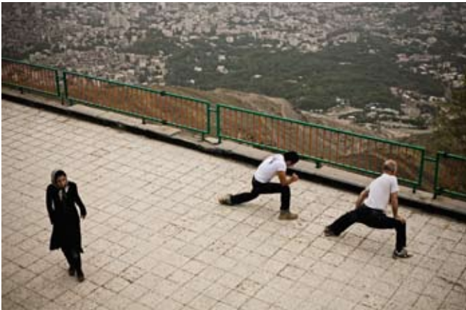
A test karbantartása, az egészségkultusz nagyon fontos Iránban: a pénteki szabadnapon teheráni férfiak százai másszák meg a Tochal hegyet, hogy ott tornázzanak.

veztek el/át), majd vissza Teheránba. Lehetne hosszan mesélni arról, hogyan énekeltem a teheráni metróban magyar népdalokat egy etnozenét gyűjtő fiatalembernek, hogyan társalogtam éjszaka nyúlóan zandjabillal (őrölt fahéj és gyömbér babonázó keverékével) ízesített teát kortyolva az iszfaháni hidak mentén, hogyan pirultam el, amikor egy-egy gyönyörű szempár a fekete csador alól rám pillantott, hogyan tartóztattak le két-